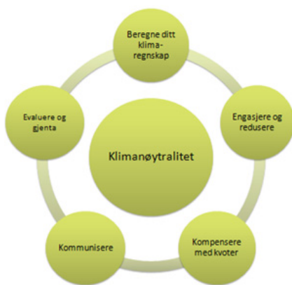
Figur 1. Organisering av arbeidet

Fokuset i dette arbeidet skal være på reduksjoner og forbedringer, og i mindre grad på kvotekjøp og opprinnelsesgarantier. (Målsettingen bør være å kjøpe så lite kvoter som mulig...) Måten dette arbeidet organiseres på vises i figur 1. Det er viktig å presisere at dette handler om utslipp knyttet til kommunens drift. Noen utslipp er, i følge FN's standard, obligatoriske å inkludere i klimafotavtrykket, mens andre utslipp er frivillige. Hvis man skal kompensere ved kjøp av klimakvoter er det en forutsetning at det kjøpes FN-godkjente kvoter. Det må dokumenteres en reell reduksjon på 1 tonn co2 for hver godkjente kvote, og kvoten blir utstedt etterskuddsvis.