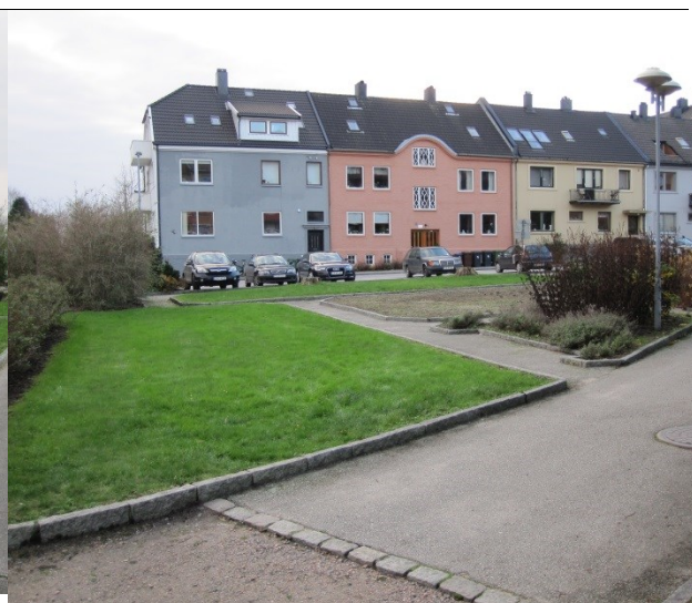
Utsikt mot vest og Østre Strandgate 66