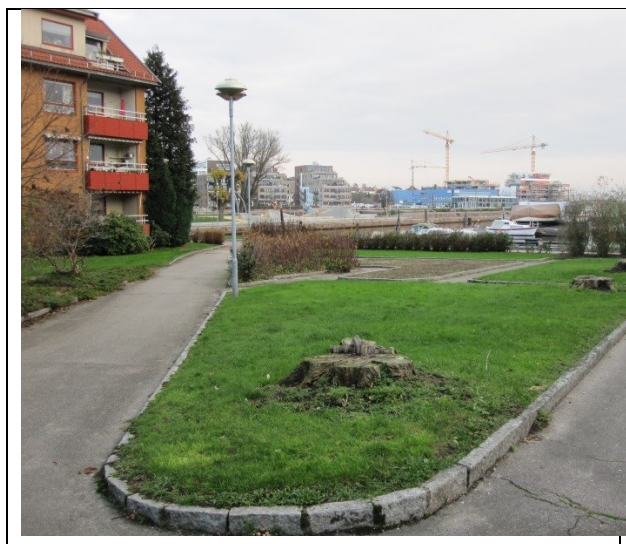
Dagens parkområde; utsikt mot Tangen Og hjørnet Østre Strandgate 70