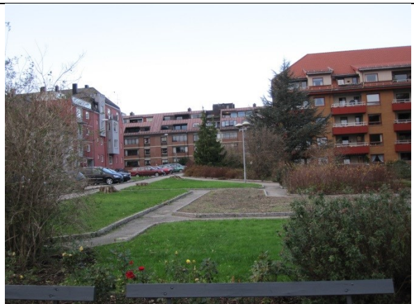
Prosjektets plassering langs Strandpromenaden Dagens parkutforming

Parkvesenet har i samarbeid med Vilhelm Krag Selskapet i Kristiansand i mange år jobbet for å markere at Vilhelm Krag vokste opp i Østre Strandgate ved Langfelts allmenning. Det aktuelle området var opprinnelig anlagt som sandlekeplass, men ble etter ønske fra boligstiftelsen for leiligheten for eldre i Østre Strandgate 70, omgjort til en liten beplantningspark. Siden har det i årenes løp vært tegnet flere skisser for å få anlagt en markeringspark for Vilhelm Krag her, et arbeide Vilhelm Krag Selskapet har stått i bresjen for. Nedenfor er gjengitt parkanlegget slik det er presentert i forbindelse med Parkvesenets 70 – års jubileum: Dette besto i tillegg til amfi og podium, også av flere sitteplasser og basseng.