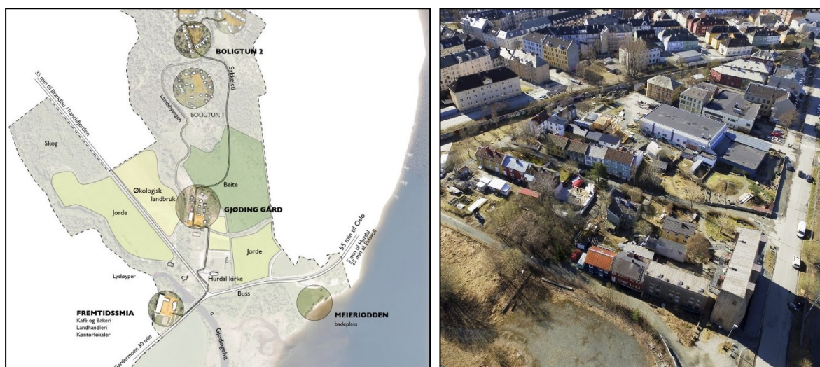
Figur 1 og 2: Skisse av Hurdal økolandsby og flyfoto av Svartlamoen

Svartlamoen ligger sentralt i Trondheim med mulighet for å bruke og 'kople seg på' byen. Christiania i København er ikke definert som økobydel, men har mange lignende trekk med en sterk selvbyggerprofil, flat organisasjon og stor medvirkning i sine prosesser. Disse økobydelene er utviklet innenfor en ramme av eldre (og til tider forfallende) bygningsmasse, som også bidrar til bydelens karakter. Modellen er mer urban og derfor aktuell å vurdere for urbane områder i Kristiansand, som bydel- eller kvartalsutvikling.