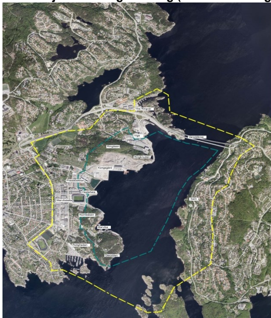
Illustrasjon: Planavgrensning (indre markeringslinje) og influensområde (ytre markeringslinje)