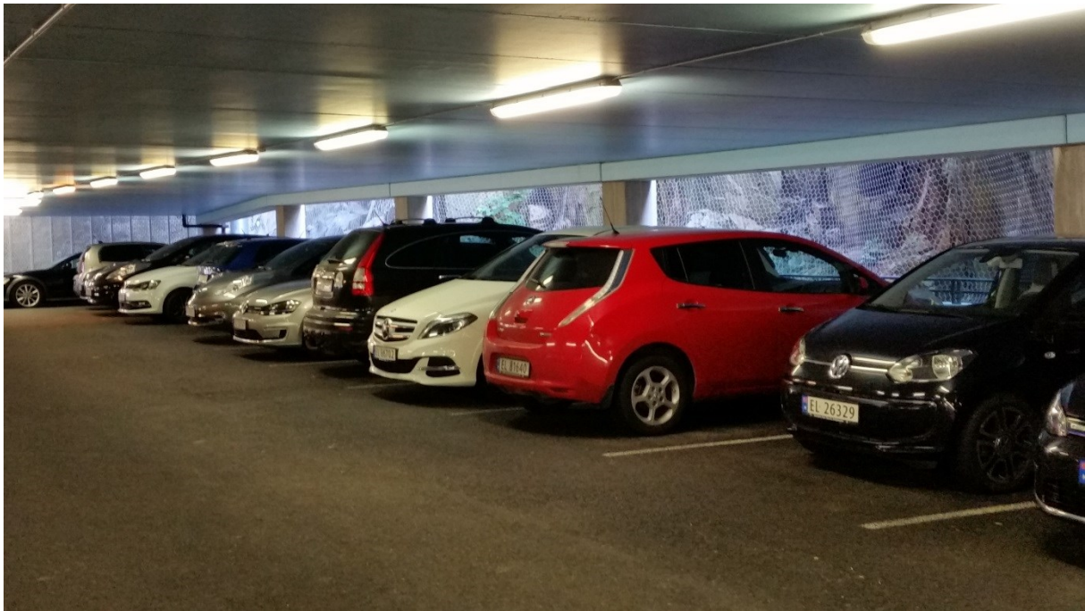
Bilde fra parkeringshuset Kilden september 2016, hvor det er betalingsfritak for elbiler uten maksimaltid.