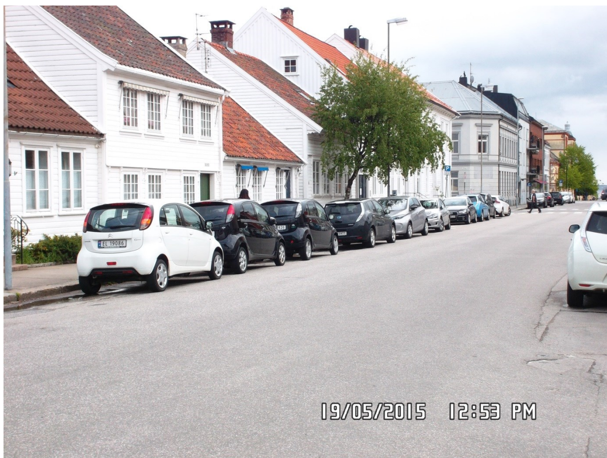
Bilde fra Holbergsgate før maksimaltid var innført.

I følge SSB var det registrert 429 elbiler (personbiler) i Kristiansand kommune i 2013. Tilsvarende tall i 2014 og 2015 utgjør hhv. 960 og 1832, dvs. en økning på 124 % og 91 %. I hele Vest-Agder var det registrert 2760 (personbiler) ved utgangen av 2015. Andelen i Kristiansand (2015) utgjør dermed om lag 2/3 av alle registrerte elbiler i Vest-Agder. I 2015 var om lag 19 % av alle nye personbiler i Vest Agder en elbil. I Kristiansand utgjør elbilene (person) om lag 5 % av personbilparken. Tilsvarende for Vest Agder er ca. 3 % av personbilparken.