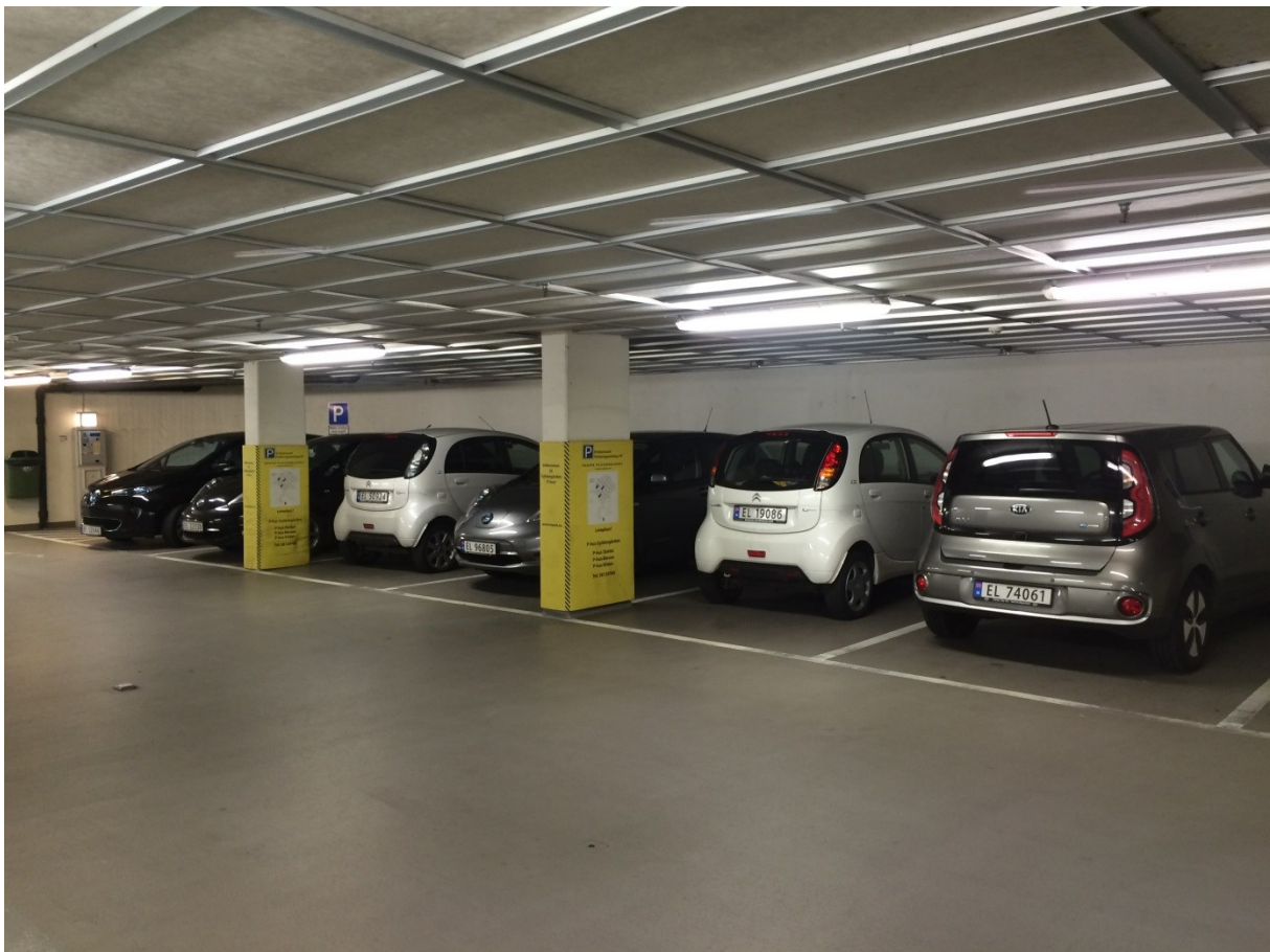
Bilde fra Gyldengården oktober 2016 utenfor bomanlegget, betalingsfritak med maksimaltid 3 timer.