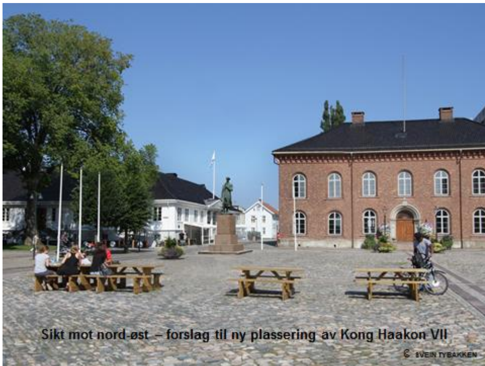
Fotomontasje av opprinnelig flyttings forslag (alternativ 2) sett fra fontenen.