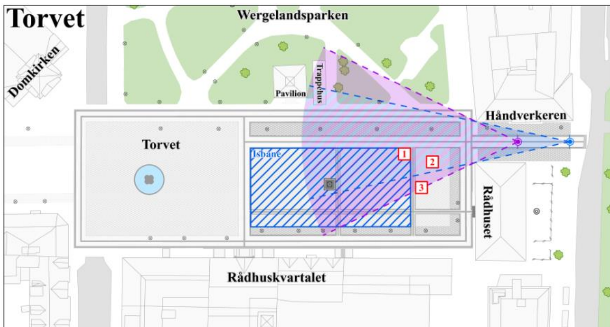
Oversikt plasseringsforslag i forhold til Torvets mønster og fremtidig isbane, samt siktforhold inn fra Festningsgata