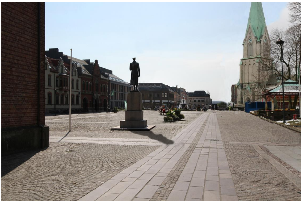
Fotomontasje av forslag (2) sett fra Festningsgata, ved fremtidig situasjon uten trær på torget