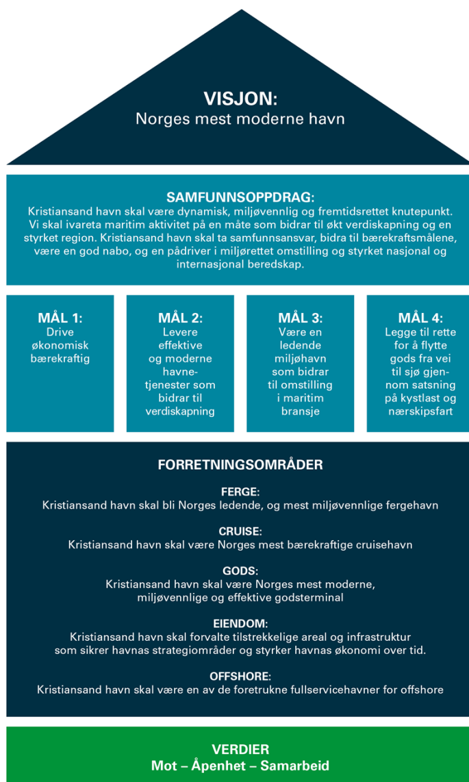
Figur 1: Strategihus

Som en naturlig følge av sammenslåingsprosessen er det behov for å legge inn et nytt strategiområde. Fiskeri har vært en betydelig satsing i tidligere Mandal havn og Lindesnes kommune. Den satsingen ønsker Kristiansand havn IKS å videreføre og forsterke. Ved en utvidelse av fiskeri som eget forretningsområdet er det naturlig å vedta strategiplanen til tidligere Kristiansand havn KF som det styrende dokumentet for Kristiansand havn IKS.