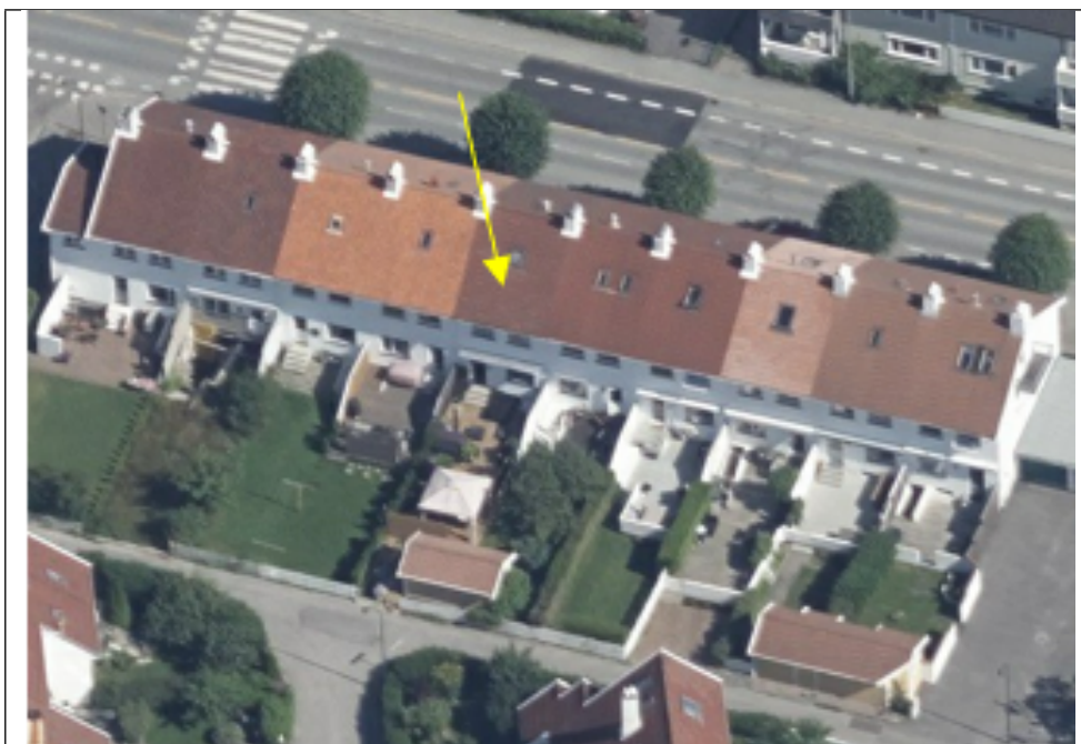
Situasjon etter omsøkt løsning