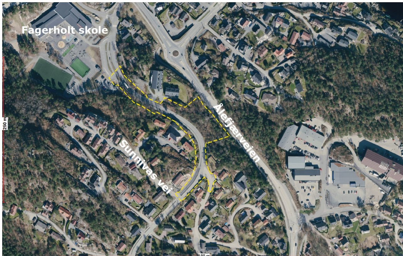
Oversiktskart. Planområdet vist med gul stiplet linje.

Planområdet ligger i Tretjønneveien på strekket mellom Fagerholt skole og Sunnivas vei. I dag er det en kombinert gang-/sykkelvei langs Tretjønneveien med varierende bredde mellom 2,5 m og 4,0 m. Gang-/sykkelveien er adskilt fra kjøreveien med en lav betongfender. Den har forholdsvis stor stigning (opptil 9%) og en blanding av mange gående og syklende skoleelever. Dette gir et stort konfliktnivå mellom gående og syklende og gjør at veien oppleves trafikkfarlig, spesielt for de minste skolebarna.