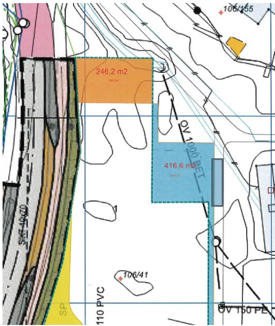
Bilde 1: Arealer