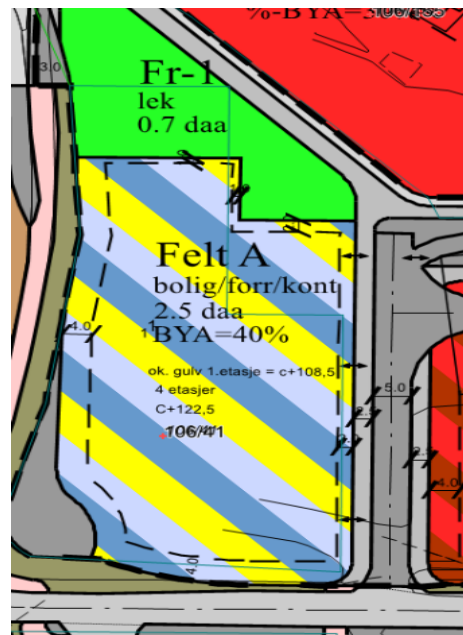
Bilde 2: Reguleringsformål

TTF Bygg AS har i etterkant av reguleringsplanen ble vedtatt, fått godkjent en utomhusplan som viser at det aktuelle området som ønskes ervervet skal brukes til varelevering og nedkjøring til parkeringskjeller.