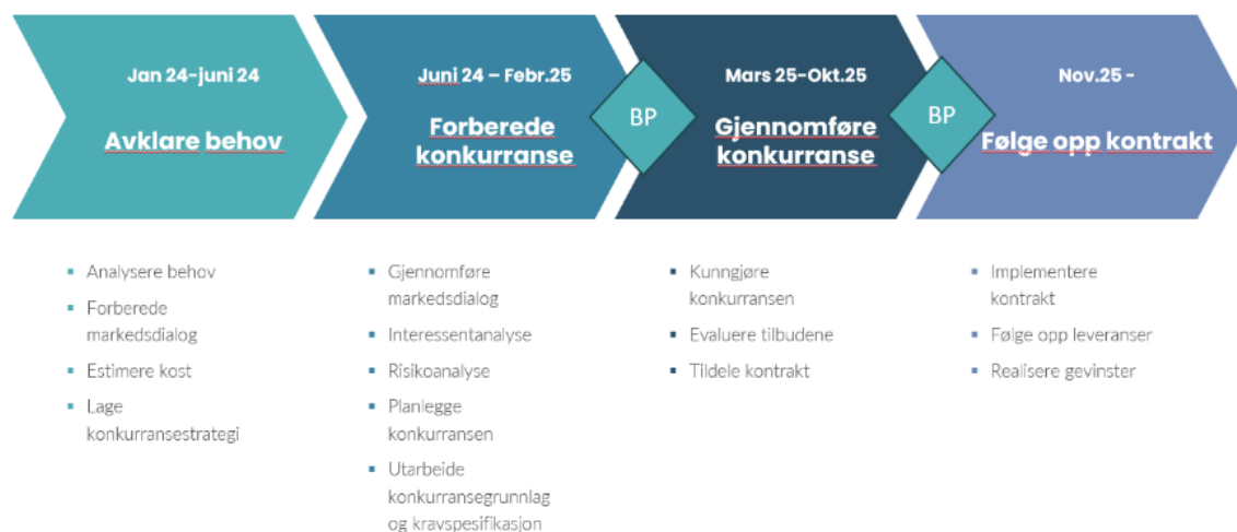
Figur 2. Prosjektplan

Kristiansand kommune skal anskaffe EPJ systemer til pleie og omsorgstjenestene, akuttmedisinske tjenester og forebyggende tjenester. I internt prosjekt benyttes aktivt erfaringer og produkter som utarbeides i Boen-samarbeidet og Felles journalløft. Prosjektet er nå i fasen «forberede konkurranse» og har en tentativ plan om å lyse ut konkurransen våren 2025.