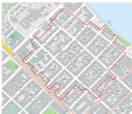
Høringsforslag til ny avgrensning av sonen