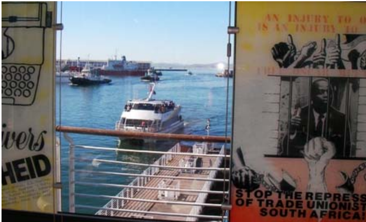
Båten fra Robben Island Museum ankommer Nelson Mandela Gateway i Cape Town