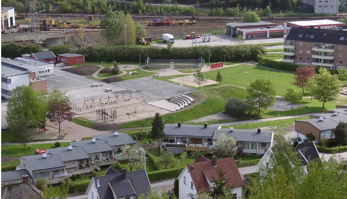
Bildet viser nærmiljøparken på Krossen skole.

Arbeidet endte opp i dagens kommuneplanbestemmelser § 9.