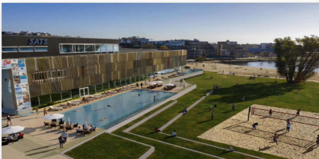
Figur 1 Skisse som viser ønsket tiltak.

Tid og fremdrift er av sentral betydning - både med tanke på dispensasjon som har begrenset varighet, samt et behov for å sikre en rask fremdrift mot et prognostisert overskudd.