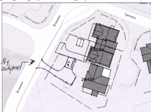
Bilde viser vedlegg til søknad av 29.11.18.

Etter at søker ble orientert om vedtaket 17.10.18 i formannskapet ble det sendt inn en ny søknad om avkjørsel. Det søkes 29.11.18 om ny avkjørsel, men denne gangen om å krysse gang- og sykkelsti og kjøre dirkete ut på Årosveien: