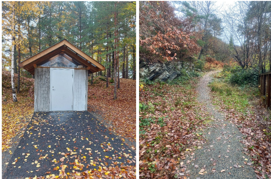
Friluftstoalett på Helteneset og utbedra turvei til fotballbane mellom Kartheia og Svaleveien. Begge er små prosjekter realisert i 2022 med investeringsmidler.