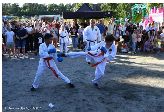
©: Harald, Sorbye 2022 Wedderheia Velforening: Vedderheiakonserten 29/8 2023 med gratis barneaktiviteter, grillmat og konsert. Tilskudd: 10 000kr.