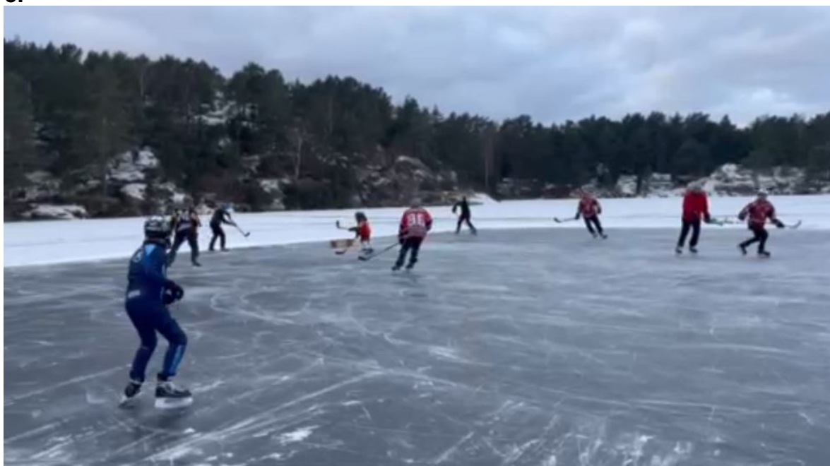
Kristiansand Ishockeyklubb: 2 is-skraper til bruk på Stampa. Tilskudd: 10 000kr.