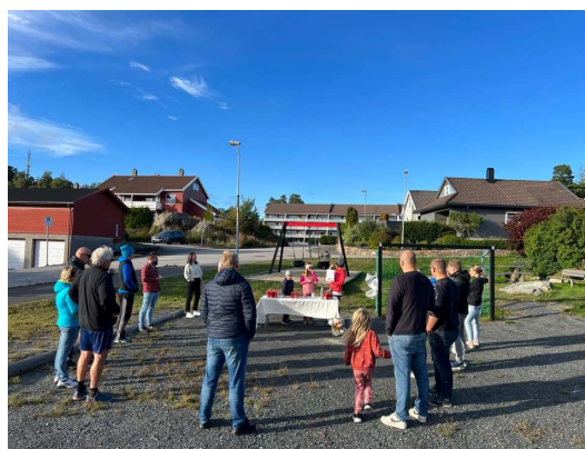
Alvestien Velforening: Forfriskning til vårdugnad, solsikkeblomstring-konkurranse og grillfest. Tilskudd: 4000kr.