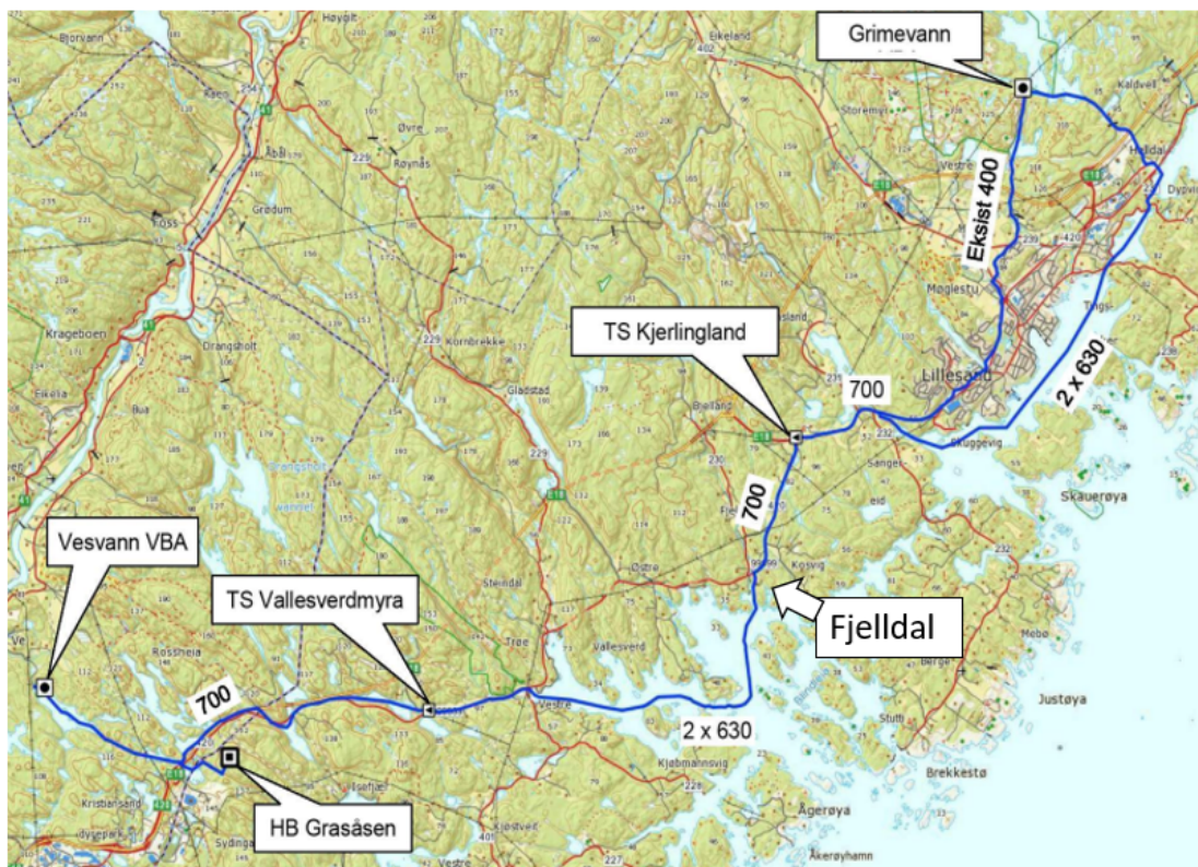
Figur 1: Kart som viser ledningsstrek og trykkøkingsstasjoner (TS).

Ny forskrift om forsyning og drikkevann (drikkevannsforskriften) trådte i kraft 1. januar 2017. For å oppfylle krav i denne og møte framtidens vannforsyningsbehov legges det fram forslag til avtale om interkommunalt samarbeid mellom Lillesand og Kristiansand kommune. Formålet med avtalen er å dekke vannbehovet i deltagerkommunene i tillegg til å dekke behovet for alternativ vannforsyning (reservevann). Selskapet skal anlegge og drive et vannverk som skal levere tilstrekkelige mengder drikkevann, av godkjent kvalitet, til deltagerkommunene med Grimevann som forsyningskilde.