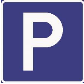
Skilt 552 Parkering