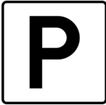
Skilt 1P Parkering

Skiltforskriftsskilt krever også skiltvedtak fra skiltmyndighet som i Kristiansand kommune er Statens vegvesen, hva angår parkeringsregulerende skilt. I Kristiansand kommune benyttes skiltforskriftsskilt stort sett tilknyttet gateparkering, mens utenfor gate benyttes vedlegg 1.