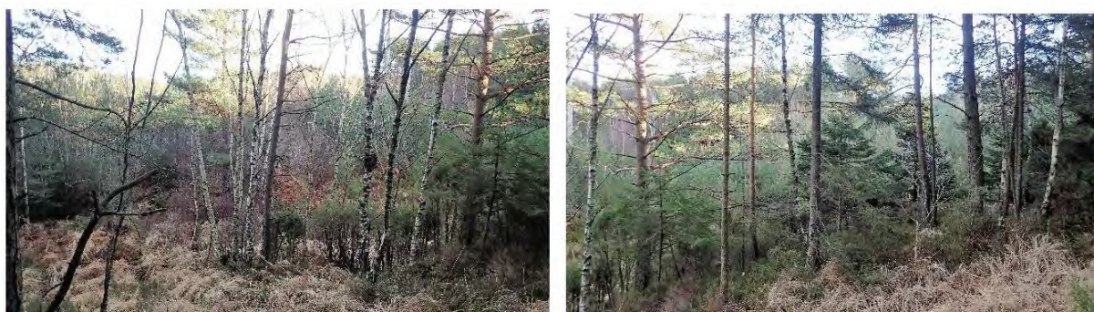
Over: området hvor høyspentlinja krysser planområdet