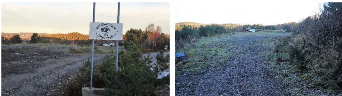
Over og under: det flate partiet midt i området