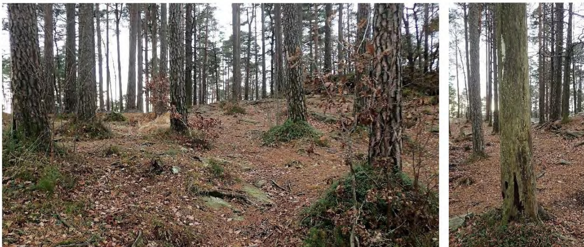
Over: området som brukes til motorsport i dag (trial)

Illustrasjonene under er fra rapport biologisk mangfold.