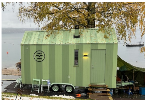
Mobil, rullende badstue i Oslo.