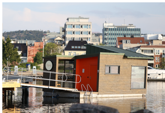
Mobil, flytende badstue i Kristiansand.