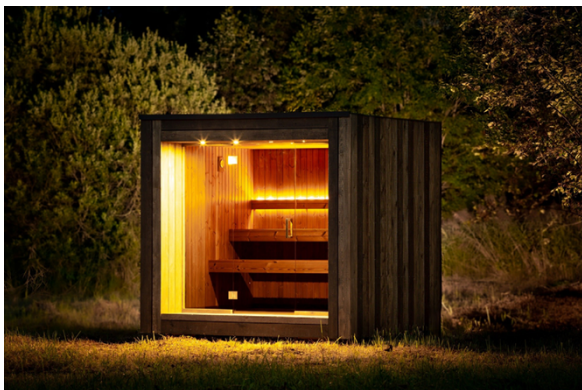
Mobil, flyttbar modulbadstue.