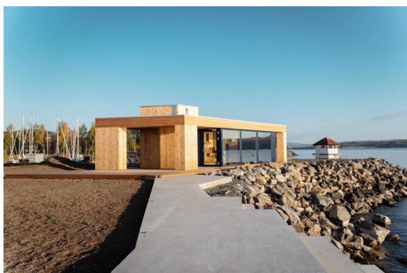
Landfast badstue på Gjøvik.

Bildene nedenfor viser eksempler på de 4 ulike badstutypene: